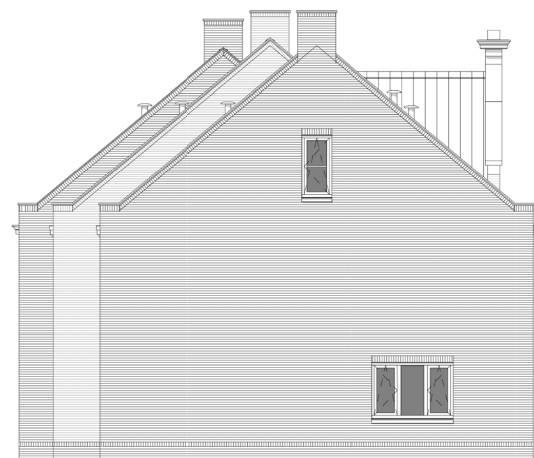
Linker zijgevel Schaal 1:100