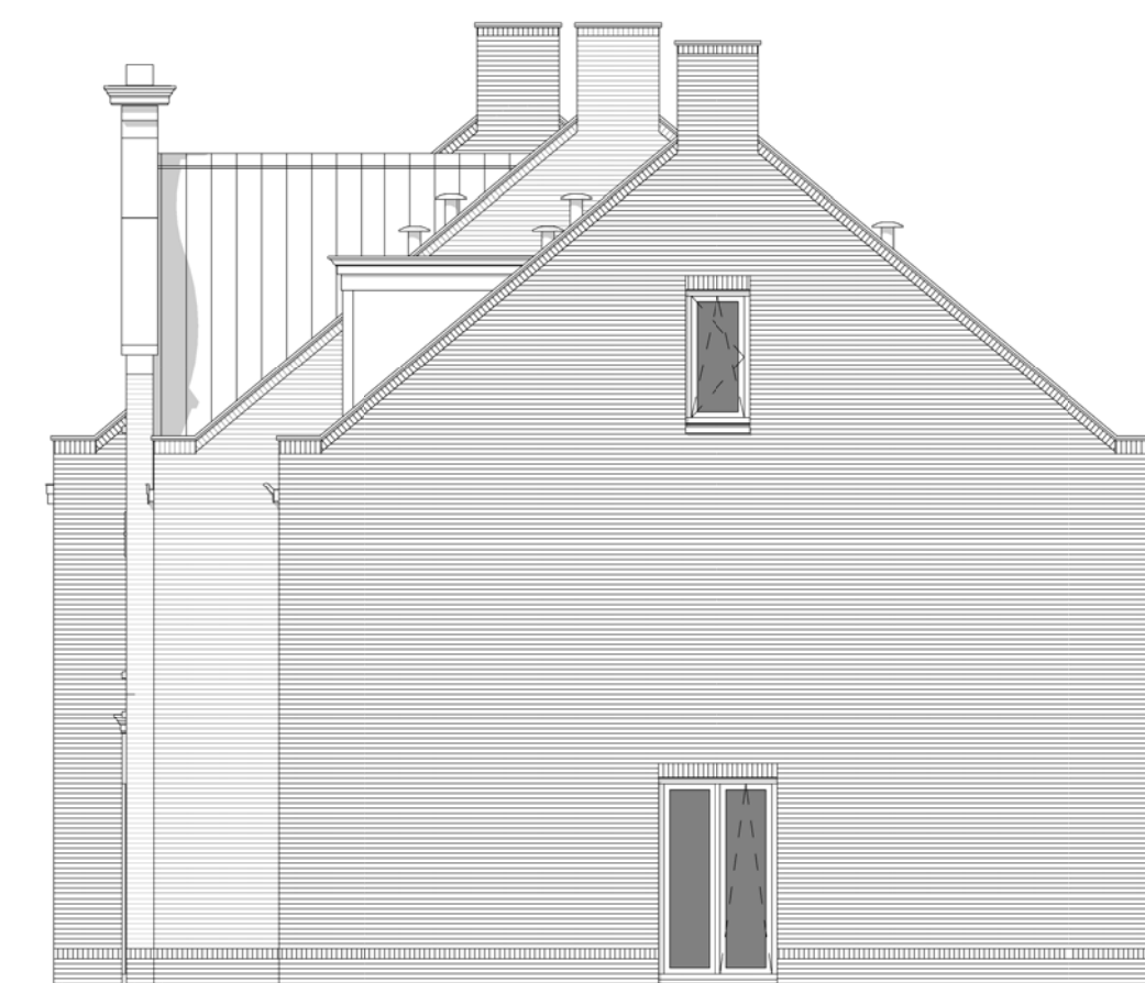
Rechter zijgevel Schaal 1:100