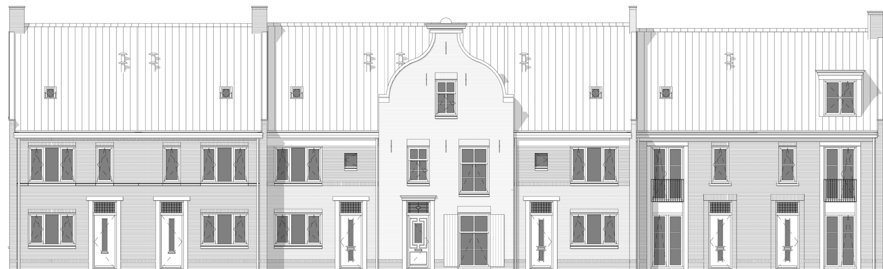
Voorgevel Schaal 1:100