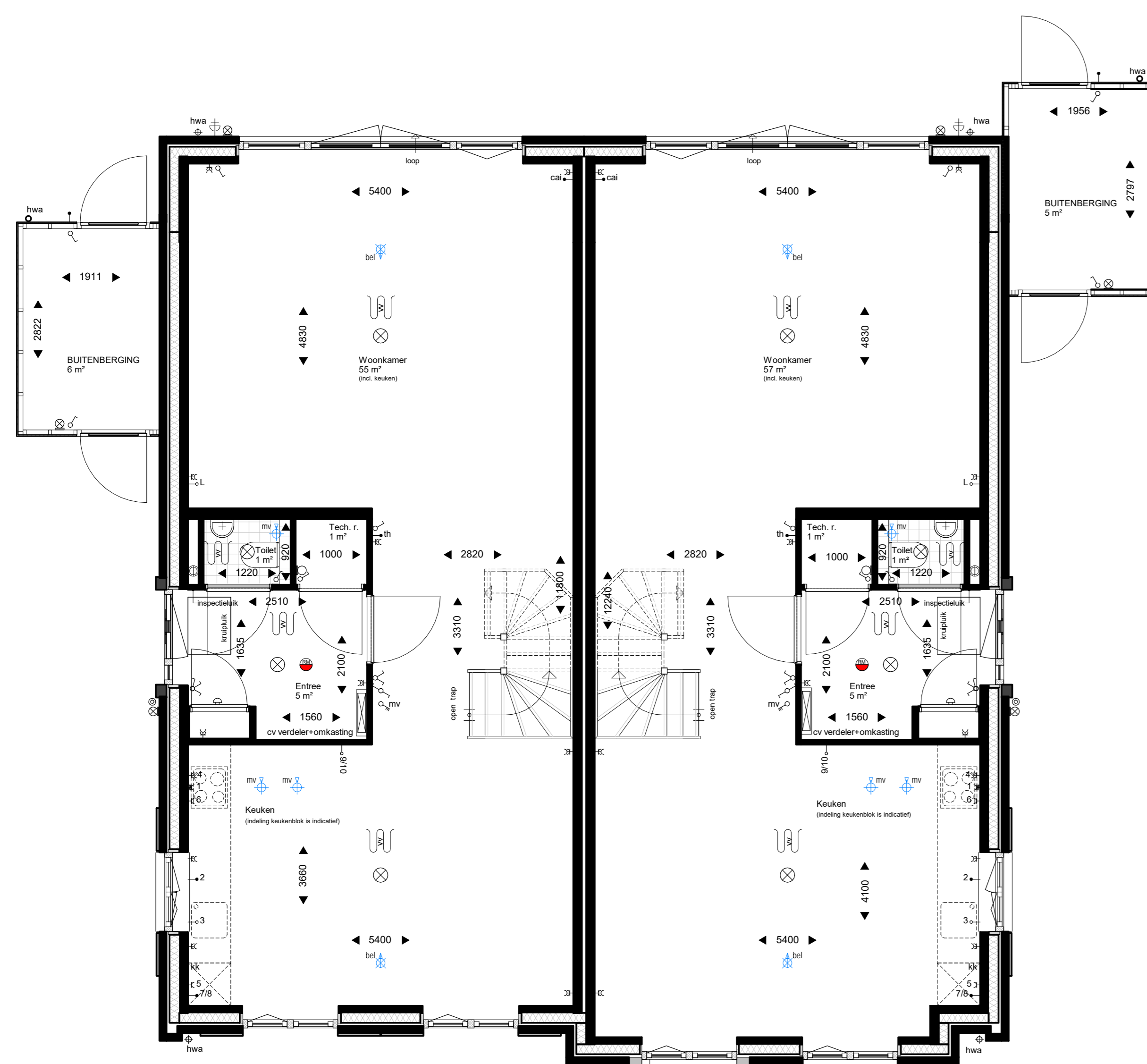
Begane grond optie 1200mm. 1 : 50