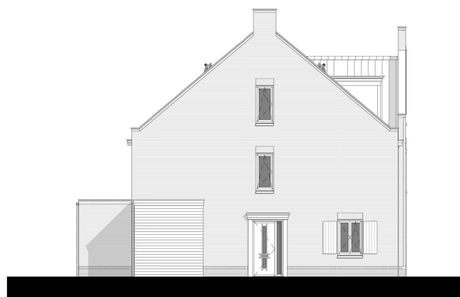
Linker zijgevel optie 2400mm. 1 : 100