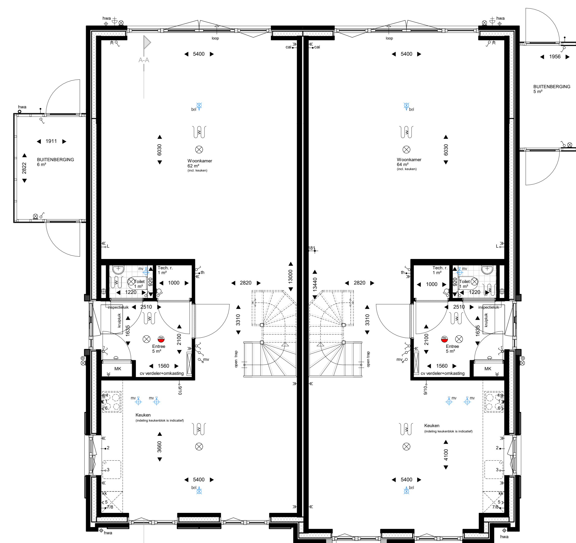
Begane grond optie 2400mm. 1 : 50

WERKNUMMER 21017 BLADNUMMER VK-07o DATUM 12-04-2022 GEWULZIGD