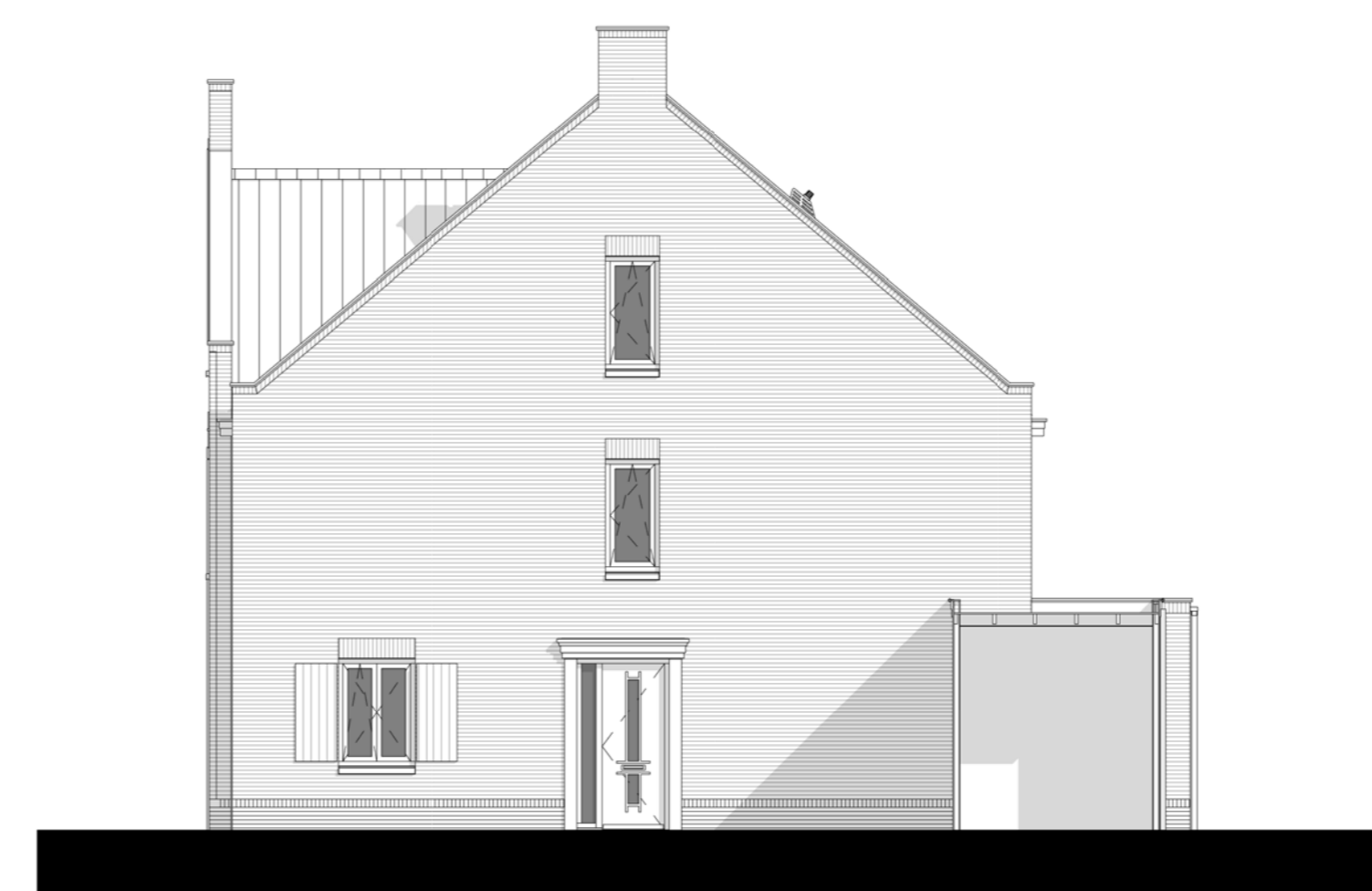
Rechter zijgevel optie 2400mm. 1 : 100